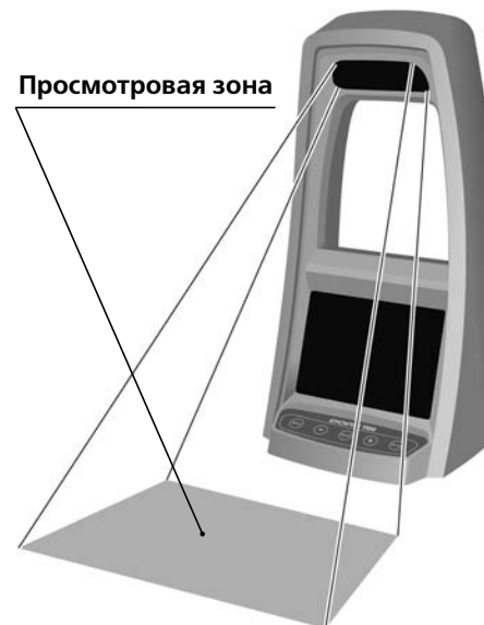
Рисунок 3 - Расположение просмотровой зоны прибора

запрещено). Интервал изменяется кнопками « + » и « - » с шагом 10 мин. Поместите банкноту в ПРОСМОТРОВУЮ ЗОНУ, как показано на рис. 3.