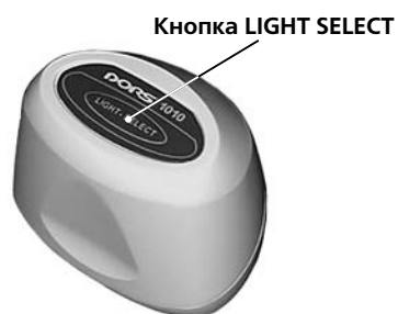
Рисунок 4 - Телевизионная лупа DORS 1010

Телевизионная лупа DORS 1020 (рис. 5) подключается ко входу V1 и позволяет проверять наличие инфракрасных (ИК/IR) и ультрафиолетовых (УФ/UV) меток в отраженном свете, проверять поверхность банкнот и др. объектов в белом косопадающем свете, контролировать наличие микропечати. Подключить лупу DORS 1020 к гнезду V1 на задней панели прибора.