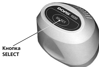
Рисунок 5 - Телевизионная лупа DORS 1020

ПРИ ПОДКЛЮЧЕНИИ DORS 1010 ИЛИ DORS 1020 К ДЕТЕКТОРУ DORS 1100 ДЕТЕКТОР ДОЛЖЕН БЫТЬ ОТКЛЮЧЕН ОТ СЕТИ ЛИБО НАХОДИТЬСЯ В ДЕЖУРНОМ РЕЖИМЕ