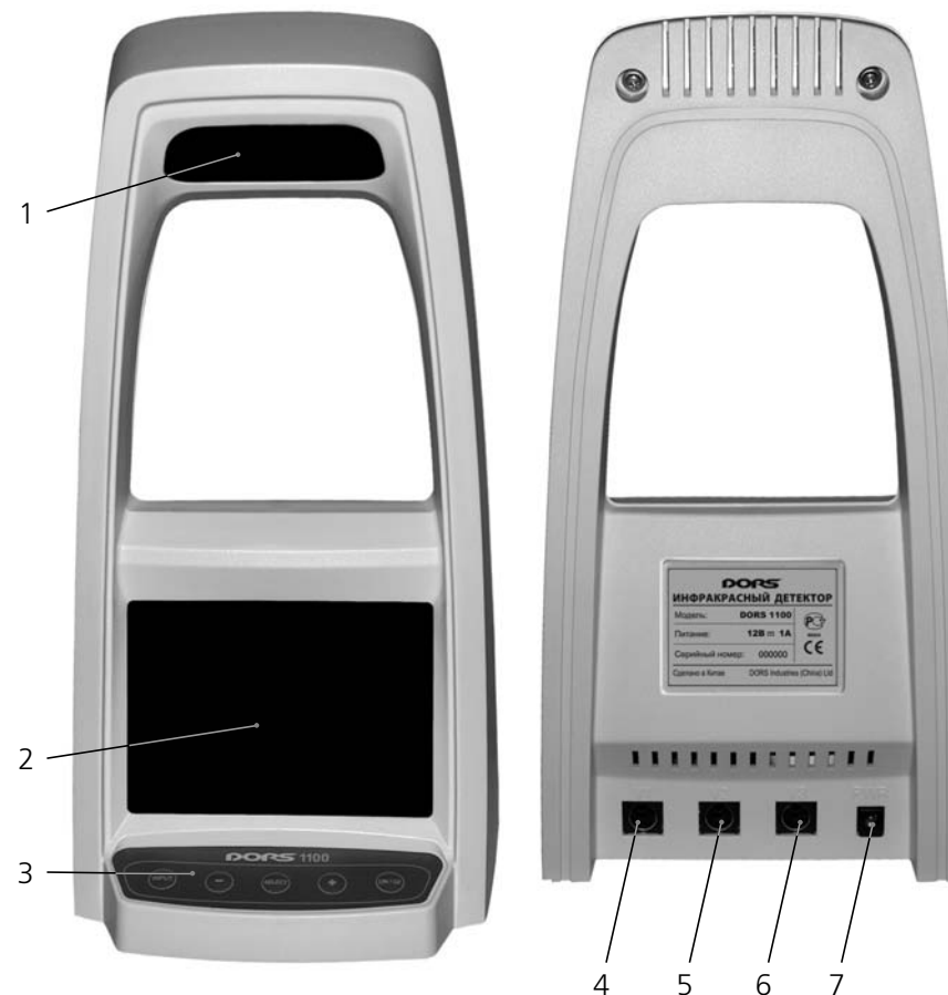
Рисунок 1 - Компоненты прибора